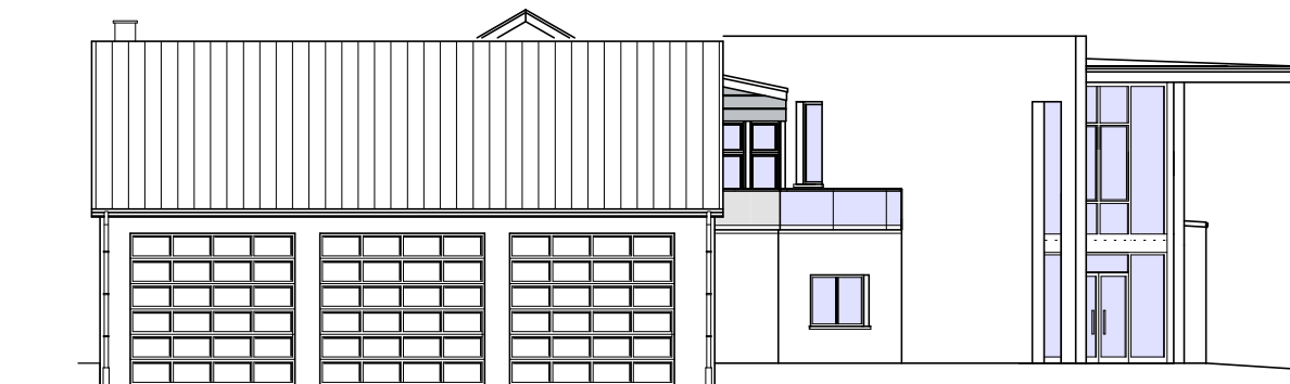
FACADE LATERALE GAUCHE