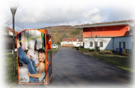
Steinheim – "Fräihof" – Rue de la Montagne