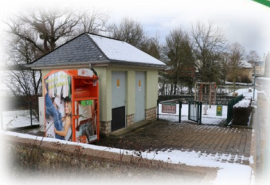
Herborn – Al Schmedt