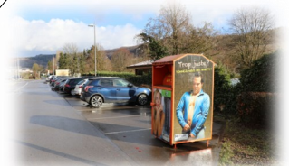
Born – 5, Um Salzwaasser