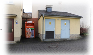
Moersdorf – 10, Um Kiesel