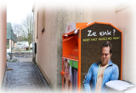
Mompach – 10, Um Buer